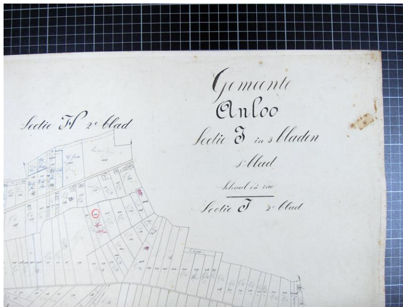
Detail kadasterkaart 1880, (rondje met kruisje eraan vast is de plek van de molen)

Artikel eerder gepubliceerd in: tijdschrift TOEN jrg 1 no 1 Historische Vereniging Annen maart 2006 en op de website verdwenen molens