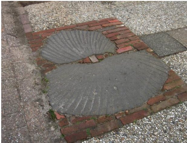
De restanten van de molensteen op het garagepad aan de Zuidlaarderweg 110

We hadden een molen in Annen. Hij staat afgebeeld op de wandplaat uit 1912 van Roelof Schuiling, temidden van de boomkruinen. Maar waar stond-ie precies? Als je bedenkt dat we een straat in Annen hebben die de Molenakkers heet, dan zal die molen toch niet ver uit die buurt gestaan hebben. Klopt, vlak bij Slager Aling, op het stuk grond van Zuidlaarderweg 108 en 110, waar tot heel onlangs de heer G. Dekens woonde. Op de overgang van de stoep naar het garagepad zie je nog de restanten van een molensteen in de grond liggen.