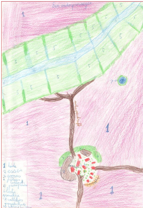
schooltekening Eric Mulders esdorp